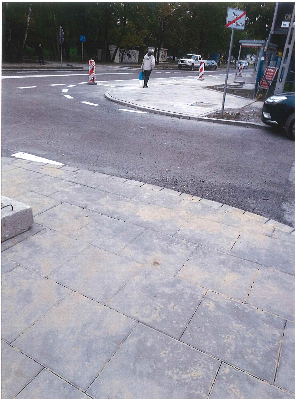
Brak obniżenia chodnika oraz zastosowania płytek z wypukłościami - widok z Trocka 14B w kierunku Orłowskiej.