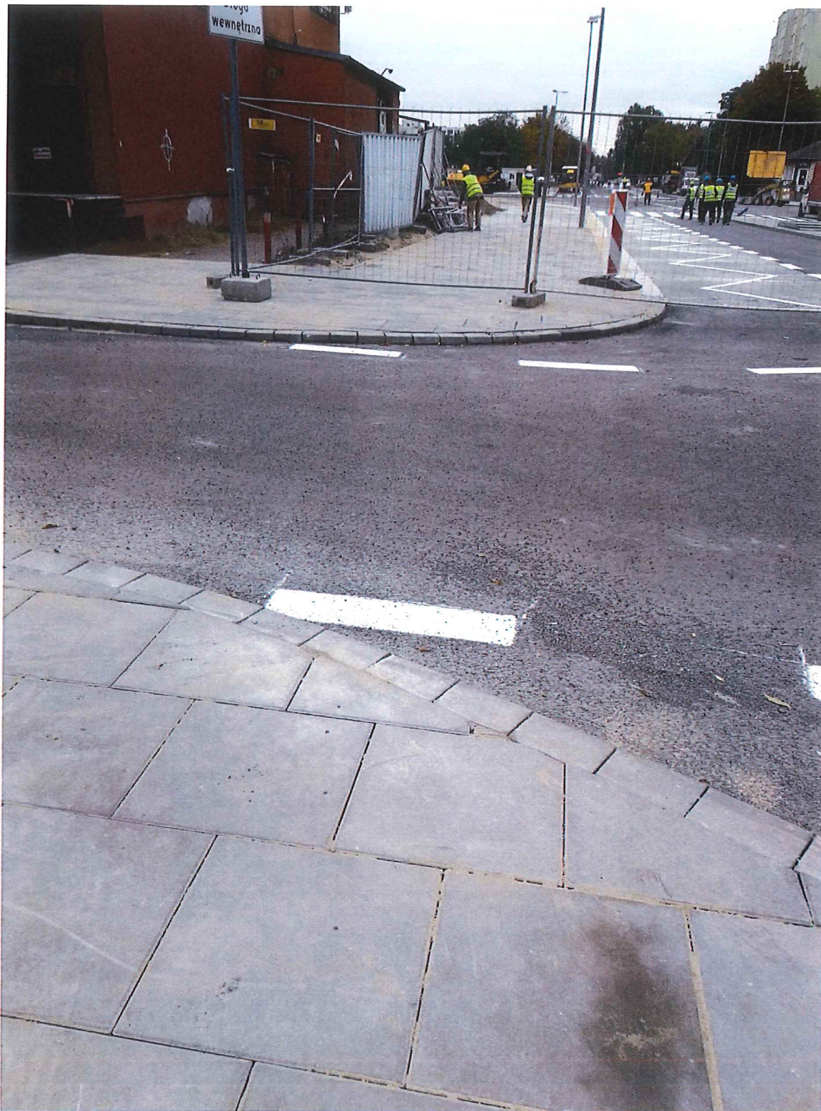
Brak obniżenia chodnika oraz zastosowania płytek z wypukłościami - widok na budynek Trocka 14B.