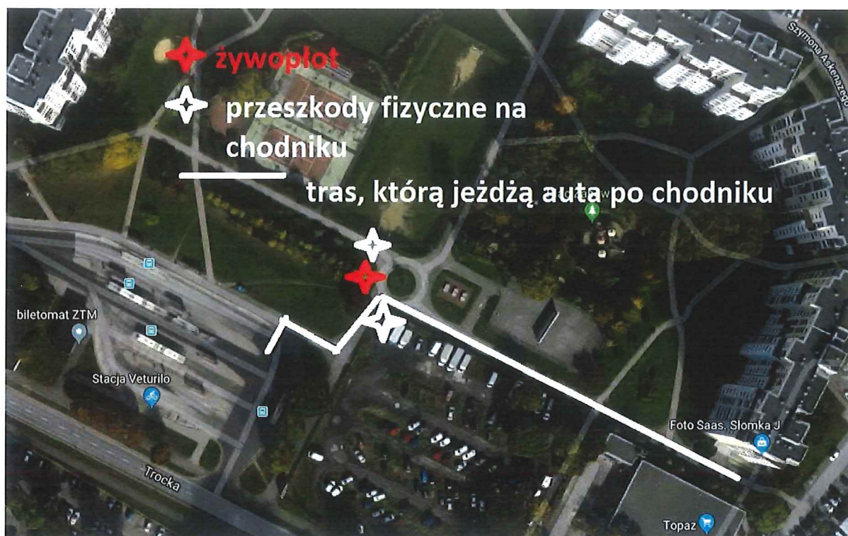
Zdj. 1. Wjazd po chodniku od pętli Trocka do Askenazego 1.

Proszę także o zwrócenie uwagi na oznakowanie pionowe w rejonie wjazdu na pętlę Targówek. Brak jest znaku Zakaz ruchu z tabliczką nie dotyczy ZTM (powinien być zgodnie z obowiązującą organizacją ruchu), co uniemożliwia egzekwowanie zakazu ruchu na pętli. Ponadto przy wjeździe na pętlę, w pasie drogi, stoi pojemnik bez nazwy na używaną odzież (pas ulic Trockiej). Proszę w obu tych kwestiach powiadomić zarządcę drogi.