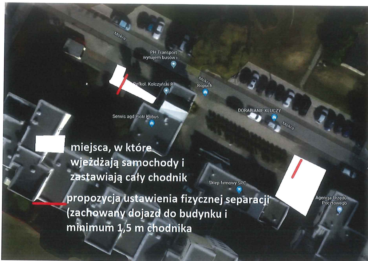
Zdj. 2. Rejon adresu Mokra 33.