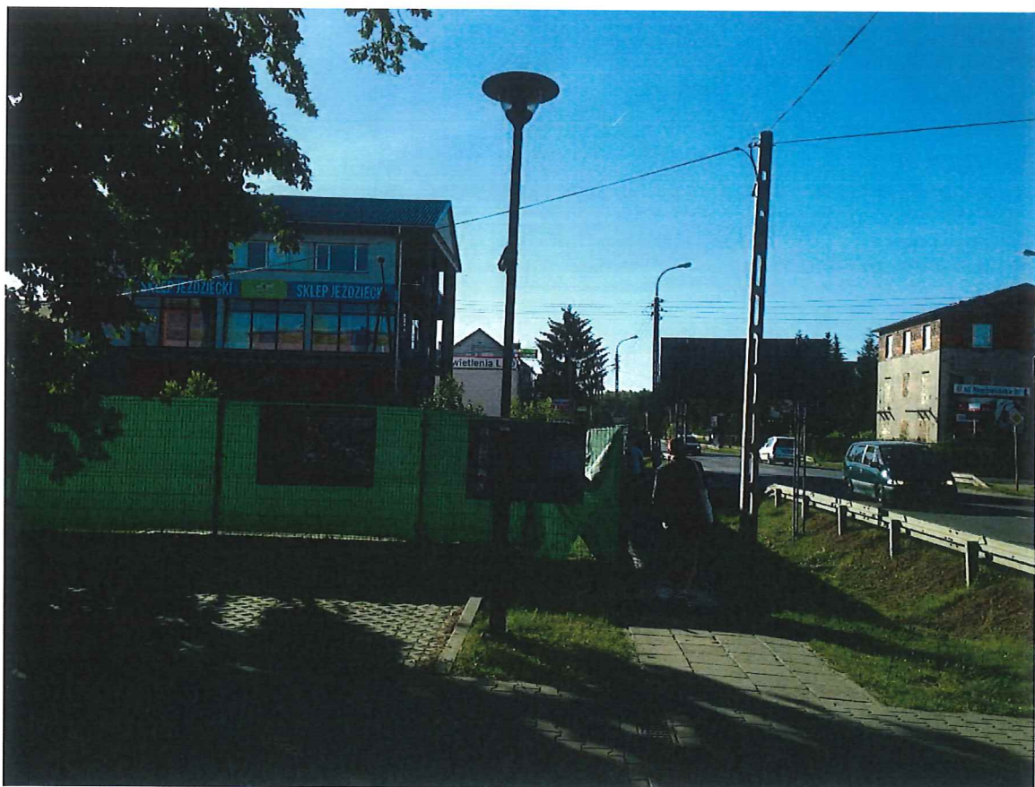
Fot. Kiedyś wzdłuż ogrodzenia Straży Pożarnej był piękny żywopłot... Dziś pozdierane plastikowe płachty...