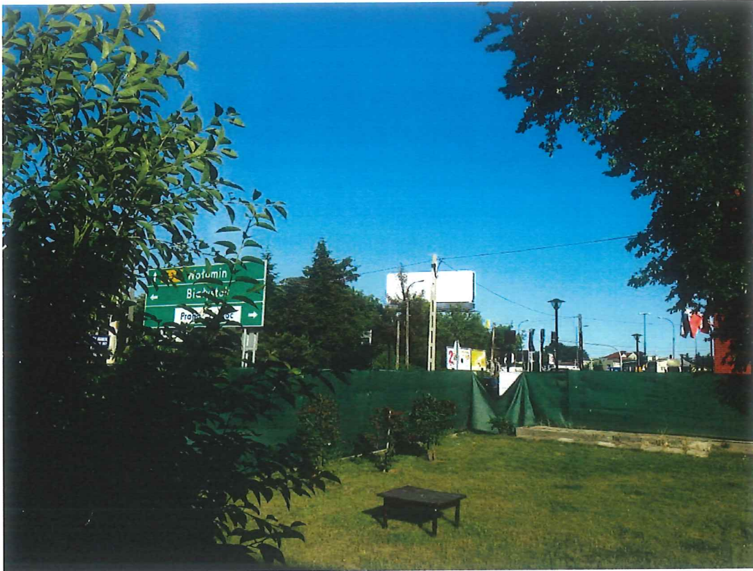
Fot. Teren Straży Pożarnej, aktualnie świecący pustkami. Niegdyś pełen zieleni.